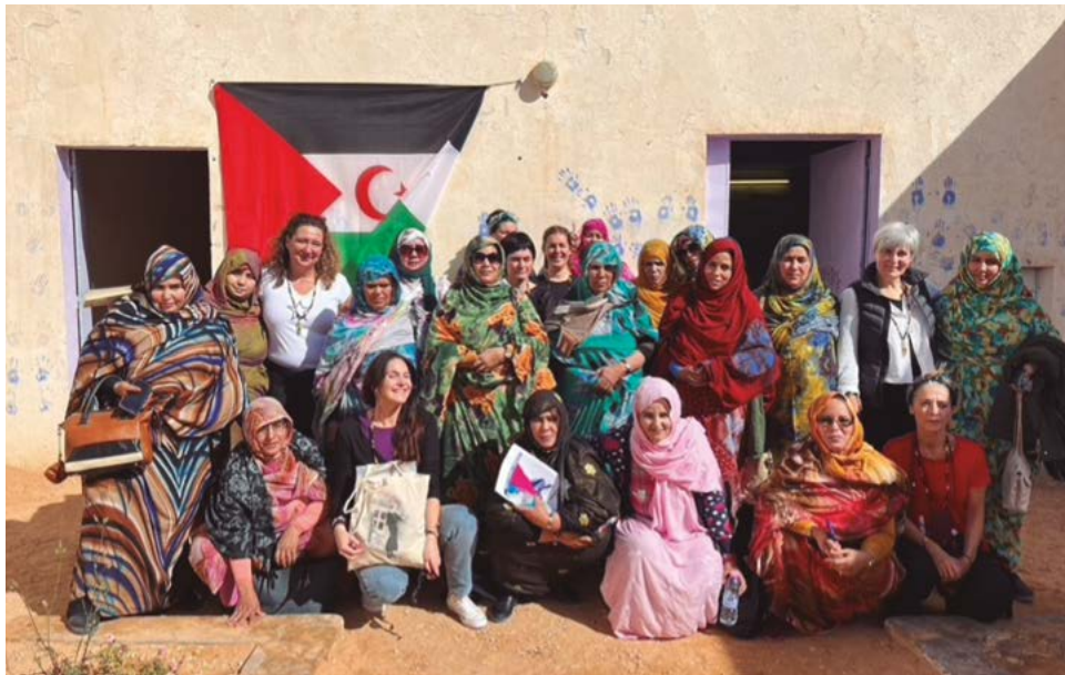
Participantes vascas y saharauis tras finalizar el taller, delante de la sede de la UNMS.